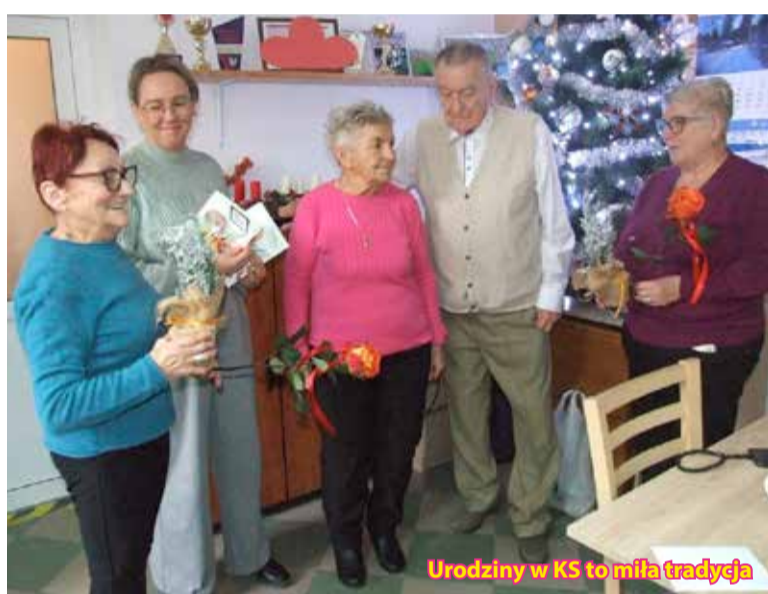
Urodziny w KS to miła tradycja

Nowe wyposażenie stanowi istotne wsparcie dla działalności OSP Silna i przyczyni się do podniesienia poziomu bezpieczeństwa mieszkańców gminy. To kolejny przykład skutecznej współpracy samorządu, instytucji publicznych oraz służb ratowniczych.