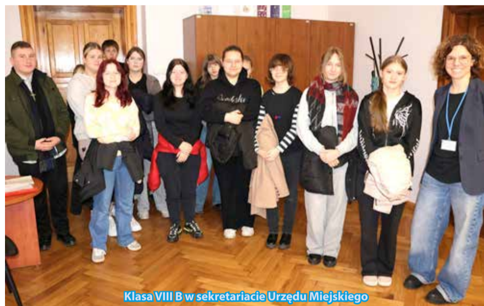
Klasa VIII B w sekretariacie Urzędu Miejskiego