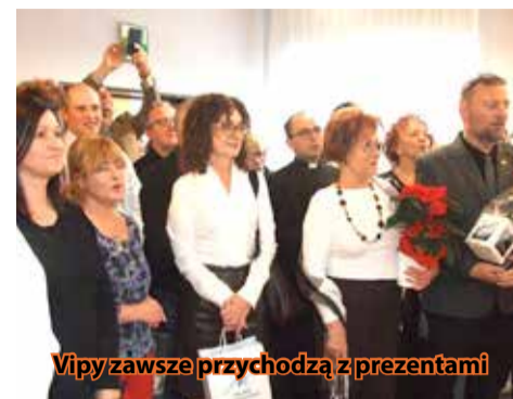
Vipy zawsze przychodzą z prezentami