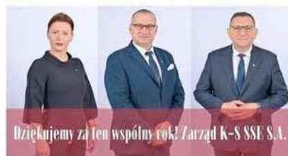
Dziękujemy za ten wspólny rok! Zarząd K-S SSE S.A.

również „odczarowanie” strefy w oczach MŚP i uświadomienie, że cała Polska funkcjonuje dziś w ramach Polskiej Strefy Inwestycji, a preferencyjne warunki wsparcia nie są zarezerwowane wyłącznie