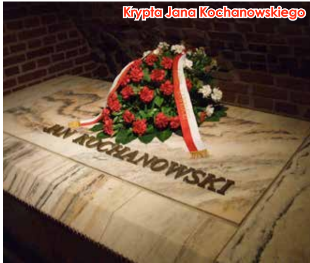
Krypta Jana Kochanowskiego