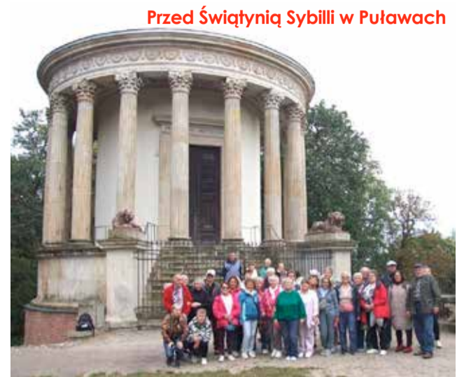
Przed Świątynią Sybilli w Puławach

Pierwszy postój z przewodnikiem, który był pilotem wycieczki, wypadł w Sulejowie nad Pilicą (ziemia sieradzka) . Wąskie uliczki i duży ruch był pewnym zaskoczeniem podczas dojazdu do opactwa cystersów, ufundowanym w XII w. przez Kazimierza Sprawiedliwego. Prawa miejskie uzyskano wiek później. Po latach prosperity zniszczenia miasta podczas potopu szwedzkiego spowodowało stagnację w rozwoju. W 1819 roku skasowano klasztor cysterski, w latach 1870-1927 miejscowość pozbawiono praw miejskich. Skomasowana budowa miasta w 80% zniszczona została przez naloty podczas ostatniej wojny światowej. Po wyzwoleniu miasto odbudowano. Głównym zajęciem mieszkańców było wypalanie wapna. A w roku 1986 do klasztoru wrócili cystersi.