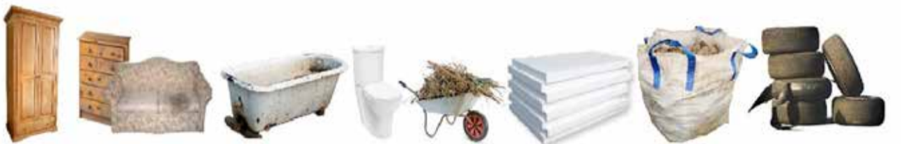
meble, kanapy, łóżka, folie, armatura łazienkowa, skoszona trawa, liście, gałęzie, styropian, gruz budowlany, odpady remontowe, opony