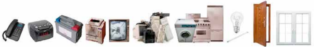
aparaty telefoniczne, radia, akumulatory, drukarki, telewizory, komputery, sprzęty AGD i RTV, żarówki, świetlówki, lampy, stolarka okienna i drzwiowa