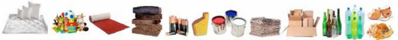
pościel, kołdry, poduszki, zabawki, dywany, materace, baterie, opakowania po olejach i klejach, farby, makulatura, tektura, szkło, plastik, odpady kuchenne