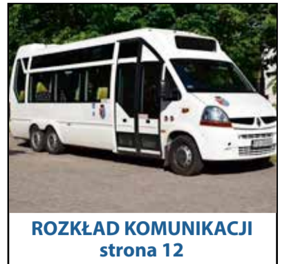
ROZKŁAD KOMUNIKACJI strona 12

KOSTRZYN NAD ODRĄ SŁUBICE GÓRZYCA RZEPIN OŚNO LUBUSKIE CYBINKA