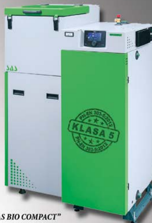
Kocioł „SAS BIO COMPACT”

WYKONAWSTWO INSTALACJI SANITARNYCH, GRZEWczyCH I GAZOWYCH