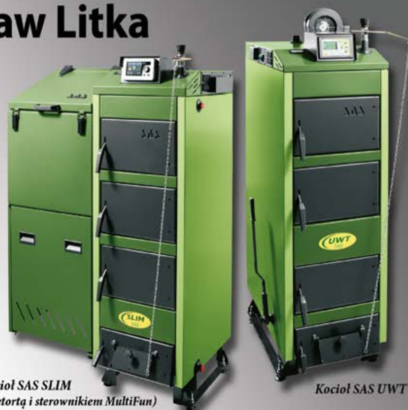
Kocioł SAS SLIM (z retortą i sterownikiem MultiFun) www.e-multifun.pl

WYKONAWSTWO INSTALACJI SANITARNYCH, GRZEWCZYCH I GAZOWYCH