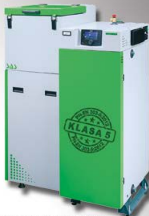
Kocioł „SAS BIO COMPACT”

WYKONAWSTWO INSTALACJI SANITARNYCH, GRZEWCZYCH I GAZOWYCH