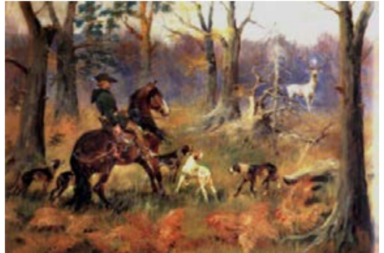
Jerzy Kossak - Święty Hubert na koniu spotyka się z jeleniem (1939)

Tradycyjnym świętem myśliwych jest dzień św. Huberta wypadający 3 listopada. W Polsce jest to też umowny termin otwarcia jesien-