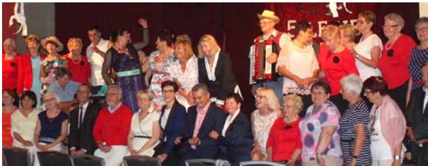
5-lecie Uniwersytetu Trzeciego Wieku w Nowym Miasteczku

K. Osos: Spotykając się z seniorami widzę jak fantastyczni, pełni pasji i energii są to ludzie. Chcą żyć aktywnie, bo umówmy się nie straszna jest starość, straszna jest samotność. Dlatego ważne jest aby Państwo usuwało przeszkody, które wykluczają seniorów z aktywnego życia społecznego. Pamiętajmy, że seniorzy są nieocenionym źródłem tzw. wiedzy pragmatycznej czyli wiedzy budowanej na podstawie długoletnich życiowych i zawodowych doświadczeń. Pozwolić im zamknąć się w domach to byłby wielki błąd. Młodsze