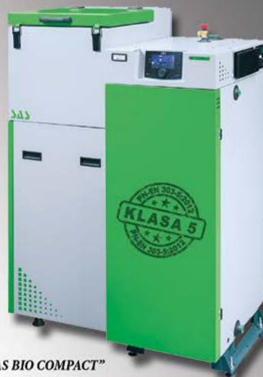
Kocioł „SAS BIO COMPACT”

WYKONAWSTWO INSTALACJI SANITARNYCH, GRZEWczyCH I GAZOWYCH