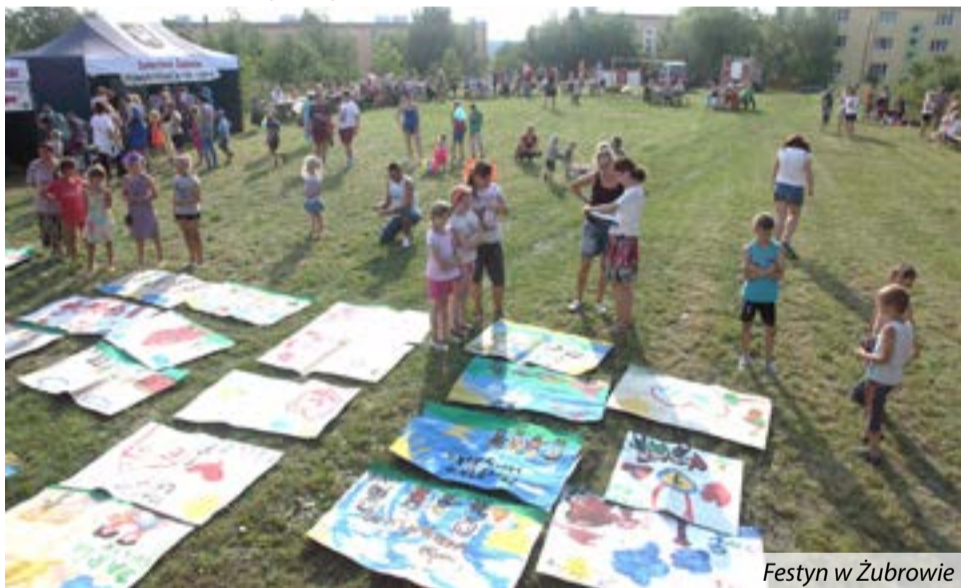
Festyn w Żubrowie

Zbliża się koniec wakacji, a wraz z nim zakończyły się festyny letnie, które odbywały się w czasie wakacji w poszczególnych sołectwach gminy Sulęcín. W tym roku festyny odbyły się kolejno w Grochowie, Tursku, Żubrowie, Drogominie i Trzemesznie. Organizatorami festynów byli: Gmina Sulęcín, Powiat Sulęcínski, Sołtysi i Rady Sołeckie każdej z wsi oraz Stowarzyszenie „Razem Żubrów”, przy wsparciu Sulęcínskiego Ośrodka Kultury. W ramach festynów organizowane były gry i zabawy dla najmłodszych oraz konkurencje sprawnościowe dla dzieci, rodzin i dorosłych. Dzieci mogły zaprezentować swoje umiejętności również w konkursach plastycznych, w których na maluchy oprócz dobrej zabawy, czekało także mnóstwo