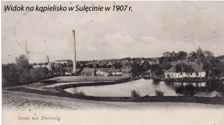
Widok na kąpielisko w Sulęciniu w 1907 r.

że w chwili obecnej gmina nawet nie znalazłaby środków na pokrycie wkładu własnego w przypadku zewnętrznej dotacji na inwestycję. Poza tym, na razie nie ma nawet odpowiednich konkursów dotacyjnych, w których gmina mogłaby starać się o pieniądze na kąpielisko. Burmistrz zapew-