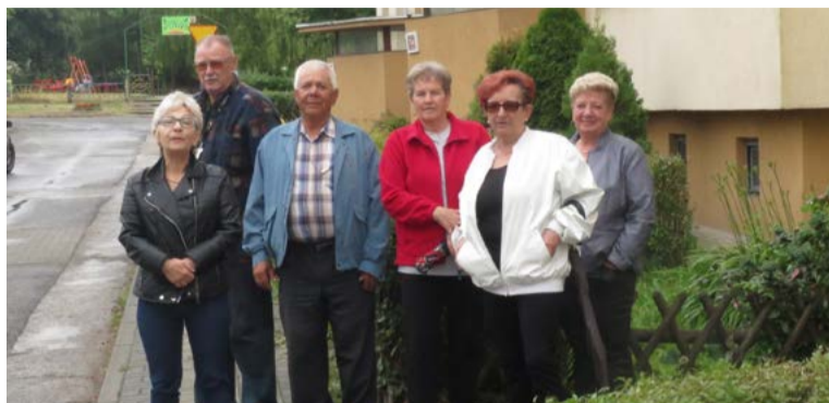
Mieszkańcy bloku nr 1 na os. Kopernika są zgodni co do konieczności powstania przy ich budynku nowych miejsc parkingowych

Mieszkańcy bloku są tym bardziej rozgoryczeni, że pod blokiem od