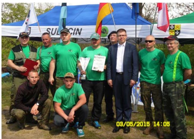
Zwycięska drużyna z Koła nr 1 PZW w Sulęcinie z burmistrzem D. Ejchartem

(Koło PZW Sulęcina nr 1, Koło PZW Sulęcina nr 2 „LIN”, Koło PZW Sulęcina nr 3 „Gumoplast”, Koło PZW Wędrzyn) oraz wędkarze z miast partnerskich: Beeskow, Friedland i Nowego Tomyśla. Zmagania wędkarzy obserwowali burmistrz Sulęcina Dariusz Ejchart oraz burmistrz Friedland Thomas Hähle . Puchar za zajęcie pierwszego miejsca w Drużynowych Zawodach Wędkarskich trafił do wędkarzy z Koła PZW Nr 1 w Sulęcinie. Na miejscu drugim znaleźli