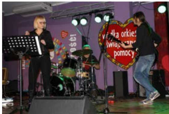
W Lubniewicach orkiestrowy finał odbył się na scenie Gminnego Ośrodka Kultury.

sklepie Intermarche, a także pokaz sprzętu ratowniczo-gaśniczego sulęcińskich strażaków. W sali widowiskowej Ośrodka Kultury na mieszkańców Sulęcina czekał m.in.: Kapsel Cross (gra w kapsle), minigolf, prezentacja klubu sportowego Stal Gorzów, pokaz motocykli, zabawy z fizyką przygotowane przez Liceum Ogólnokształcące w Sulęciniu, nauka pierwszej pomocy z Młodzieżowymi Ratownikami Przedmedycznymi, zabiegi kosmetyczne, kąciek masażu, pokaz „Światło i Dźwięk” oraz malowanie buziek