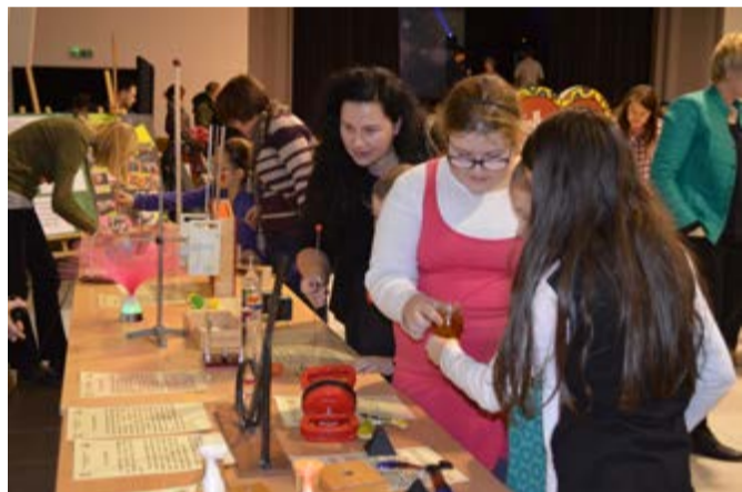
Fizyka może być ciekawa – o tym przypomnieli uczniowie z LO w Sulęciniu.