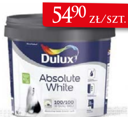
FARBA DULUX ABSOLUTE WHITE 9L