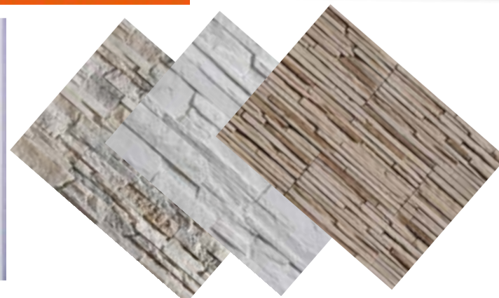
STEGU KAMIEŃ DEKORACYJNY STEGU OSHIMA 3

WIOSNĄ CZAS NA ZMIANY! DUŻY WYBÓR TAPET JUŻ OD 24,90 ZŁ ZA ROLKĘ 10MB