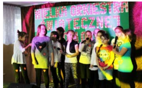
W Krzeszycach można było wylicytować m.in. obiad oraz dzień urzędowania z wójtem.