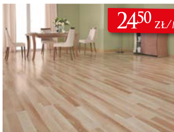
PANELE PODŁOGOWE AC4 /8MM KRONOPOL JESION HAVANA