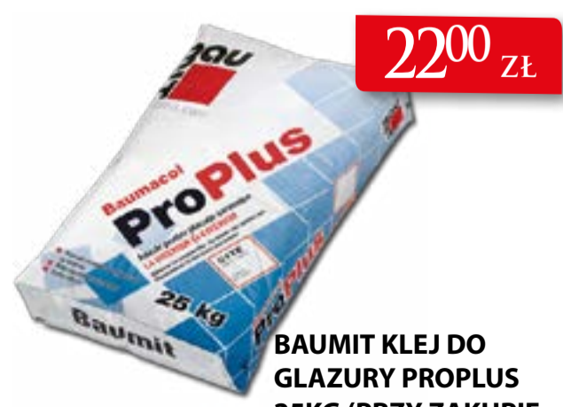
BAUMIT KLEJ DO GLAZURY PROPLUS 25KG (PRZY ZAKUPIE 6-WORKÓW KOSZULKA GRATIS)