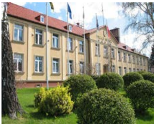
Czy gminnych urzędników czeka personalny przesiew? Czas pokaże...

związku z tym nowy szef gminy zamierza szukać oszczędności na wydatkach bieżących. - Czekamy na obniżenie pensji oraz restrukturyzację zatrudnienia - zarówno w samej gminie, jak i jednostkach podległych. Złoży też wnioski do rzecznika dyscypliny finansów publicznych o ewidentnym naruszeniu ustawy o finansach publicz-