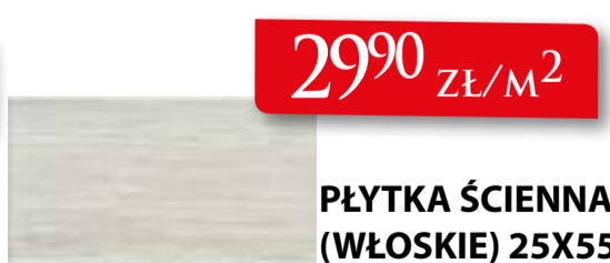
PŁYTKA ŚCIENNA (WŁOSKIE) 25X55